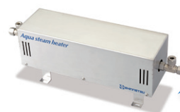
～過熱水蒸気発生器～ アクアスチームヒーター